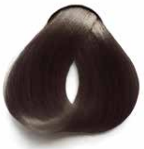
6.1 RUBIO OSCURO CENIZA DARK ASH BROWN