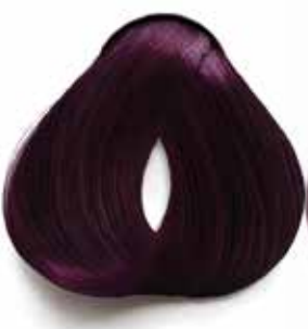
5.20 CASTAÑO CLARO VIOLETA INTENSO LIGHT BROWN VIOLET