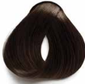
4 CASTAÑO MEDIUM BROWN