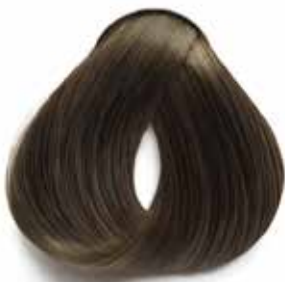
6.07 RUBIO OSCURO NATURAL FRÍO DARK NATURAL COOL BLONDE