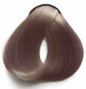
8.11 RUBIO CLARO IRISADO LIGHT IRIDESCENT BLONDE