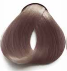
8.2 RUBIO CLARO MALVA LIGHT BLONDE MAUVE