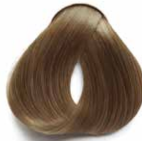
8/00 RUBIO CLARO PROFUNDO DEEP LIGHT BLONDE