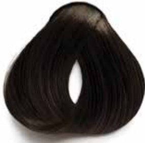
3 CASTAÑO OSCURO DARK BROWN