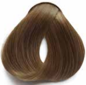
6 RUBIO OSCURO DARK BLONDE