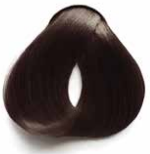
5.1 CASTAÑO CLARO CENIZA LIGHT ASH BROWN