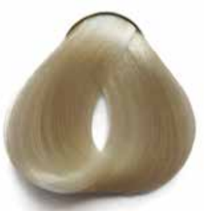
10 RUBIO EXTRA CLARO ULTRA LIGHT BLONDE