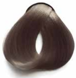
8.1 RUBIO CLARO CENIZA LIGHT ASH BROWN