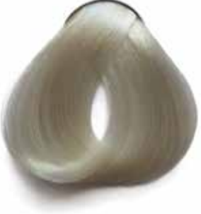
901 RUBIO SÚPER ACLARANTE CENIZA ASH ULTRA LIGHTENING BLONDE