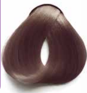
7.2 RUBIO MALVA MAUVE BLONDE