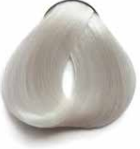
900 RUBIO SÚPER ACLARANTE NEUTRO NEUTRAL ULTRA LIGHTENING BLONDE