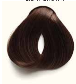
5 CASTAÑO CLARO LIGHT BROWN