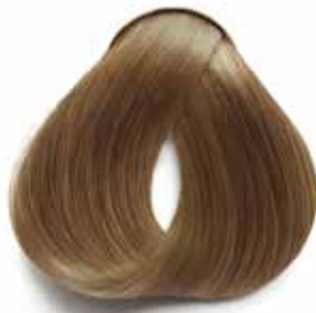
8 RUBIO CLARO LIGHT BLONDE