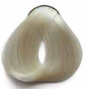
10.1 RUBIO EXTRA CLARO CENIZA ASH ULTRA LIGHT BLONDE