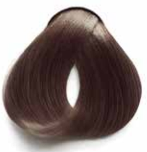
6.11 RUBIO OSCURO IRISADO DARK IRIDESCENT BLONDE