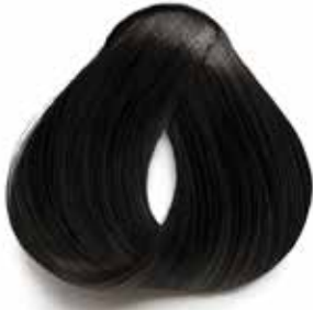
1 NEGRO BLACK