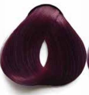
5.62 CASTAÑO CLARO ROJIZO VIOLETA LIGHT BROWN VIOLACEOUS REDDISH