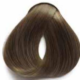
7.07 RUBIO NATURAL FRÍO NATURAL COOL BLOND