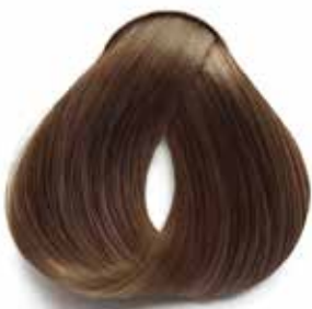
6NC RUBIO OSCURO CÁLIDO DARK WARM BLONDE